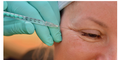
Anwendung von Botox bei sog. Krähenfüßchen

Besonders effektiv ist Botox bei gezielt zurückhaltender (häufig werden Hollywoods Botoxgesichter kritisiert, die keine Emotionen zeigen und uns mit ihrer starren, kühlen Optik irritieren) Anwendung zur Behandlung der mimischen Muskulatur und damit der mimischen Falten. So kann es sehr effektiv bei den sog. Krähenfüßen (kleine Lachfältchen am Auge), Stirnfalten und den sog. Zornesfalten eingesetzt werden, in der Monotherapie, in Kombination aber auch mit Fillern (Hyaloron).